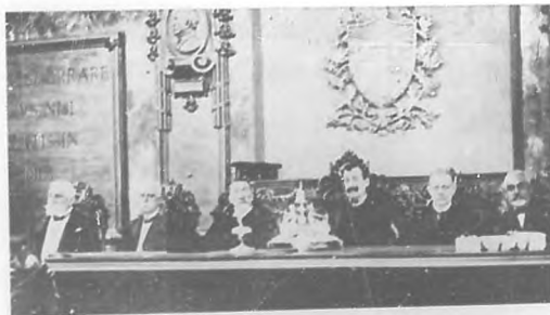
Solemne acto de la apertura del nuevo curso escolar. — El Secretario de Instrucción Pública presentando la sesión inaugural. — Mesa presidencial.

Ministro de México en España, fallecido en Madrid en donde se tributaron grandes honores al cadáver que, á bordo del "Español" y de paso para México, estuvo en la bahía recibiendo honores de las autoridades cubanas y colonia mexicana.