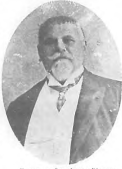
Excmo. señor Justo Sierra